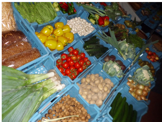
• Oogstdankfeest Dongen 2016

Nu steeds meer mensen, als nooit tevoren, zich bewust worden hoe belangrijk voeding is, wordt het Oogstdankfeest ook een gelegenheid om hier aandacht aan te besteden. Ons lichaam is voor ons het grootste geschenk van de schepping. Daarom is het noodzaak om goed voor ons lichaam te zorgen, want wat we eten en drinken is bepalend voor ons leven. Wat we tot ons hebben genomen, zal ook in onze uitstraling doorwerken.