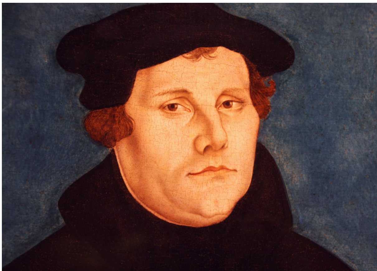
Maarten Luther, 1483 - 1546

Wanneer je aan een rooms-katholiek vraagt naar de beeldvorming rond Luther, dan blijkt de ketter van 500 jaar geleden eerder iets te hebben van een “klokkenluider” die in de kerk allerlei misstanden signaleerde. Dat betekent, dat er in die afgelopen vijf eeuwen veel veranderd is in de verhouding tussen rooms-katholieken en protestanten. Dat leden van beide kerken een gemeenschappelijke reis ondernemen naar de verschillende plaatsen waar Luther gewoond en gewerkt heeft, (zoals bv. in september a.s. vanuit Oosterhout) was jarenlang ondenkbaar en in onze tijd een positief signaal van wederzijdse herkenning en erkenning als gelovigen. Niet alleen heeft het rooms-katholieke Lutheronderzoek voor deze ontwikkeling gezorgd, maar ook is binnen de kerkelijke praktijk sprake van een groeiende toenadering. Het begrip katholiciteit in ons belijden (de apostolische geloofsbelijdenis zegt: “Ik geloof een heilige, algemene (= katholieke ) christelijke kerk”) kan een katalysator 1 zijn voor deze ontwikkeling. In deze bijdrage wil ik graag aandacht vragen voor dit accent in de ecclesiologie.