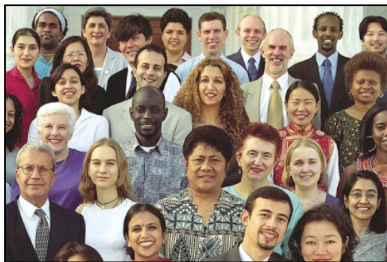
• Pluriformiteit in onze samenleving

Op een zeker moment gebeurde het. Tijdens een doordeweekse viering wilde ik aan de eerste lezing beginnen, maar toen ik het eerste woord wilde uitspreken voelde ik: Dit kan ik niet voorlezen, het was gruwelijk en onbarmhartig. Niet dat ik de lezing niet kende en verrast werd. Ik had ze wel degelijk van tevoren doorgelezen, maar net voordat ik wilde gaan lezen ging ik op slot. Om de situatie te redden bladerde ik een paar bladzijden terug en vond teksten van een andere dag die volgens mij beter te verteren waren en las die toen voor. Nadien gebeurde het ook met sommige liederen die we zongen. Ik voelde me steeds ongemakkelijker worden en verlegen over de inhoud ervan.