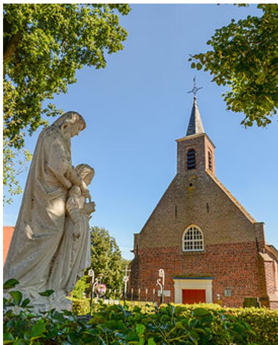
• Heilige Annakapel Molenschot

Als moeder van Maria en grootmoeder van Jezus geeft zij kennelijk veel mensen vertrouwen en troost. Haar hulp wordt niet alleen ingeroepen bij het vinden van een geschikte partner of bij het vervullen van een langgekoesterde kinderwens.