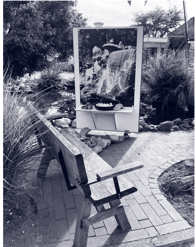
Waterval, beschrijving zie pagina 7, bij Gedenksteden

De toekomst? We hebben gezien hoe waardevol de verschillende elementen zijn en nemen dat mee. Voorlopig gaan we op Krönnenzommer door met deze vorm van herdenken.